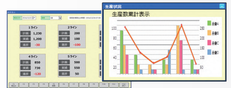
例) 生産進捗表示画面