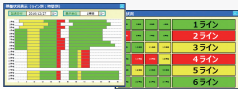
例) 設備稼働状態表示画面